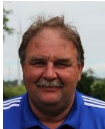
2. Jugendobmann SG Jugendobmann TSV DE Viöl