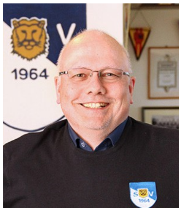
1. Jugendobmann SG Jugendobmann BW Löwenstedt